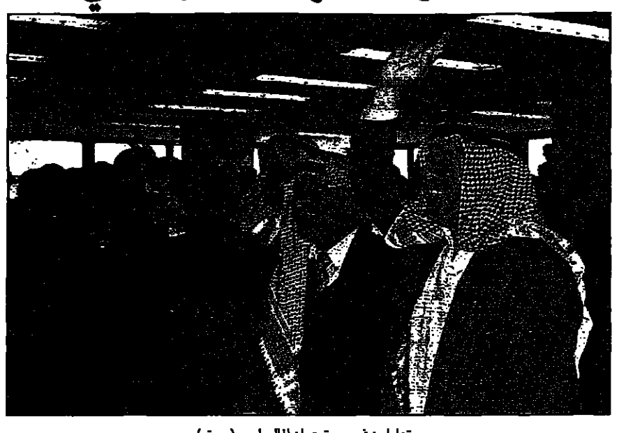
تداول في سوق عمان المالي امس